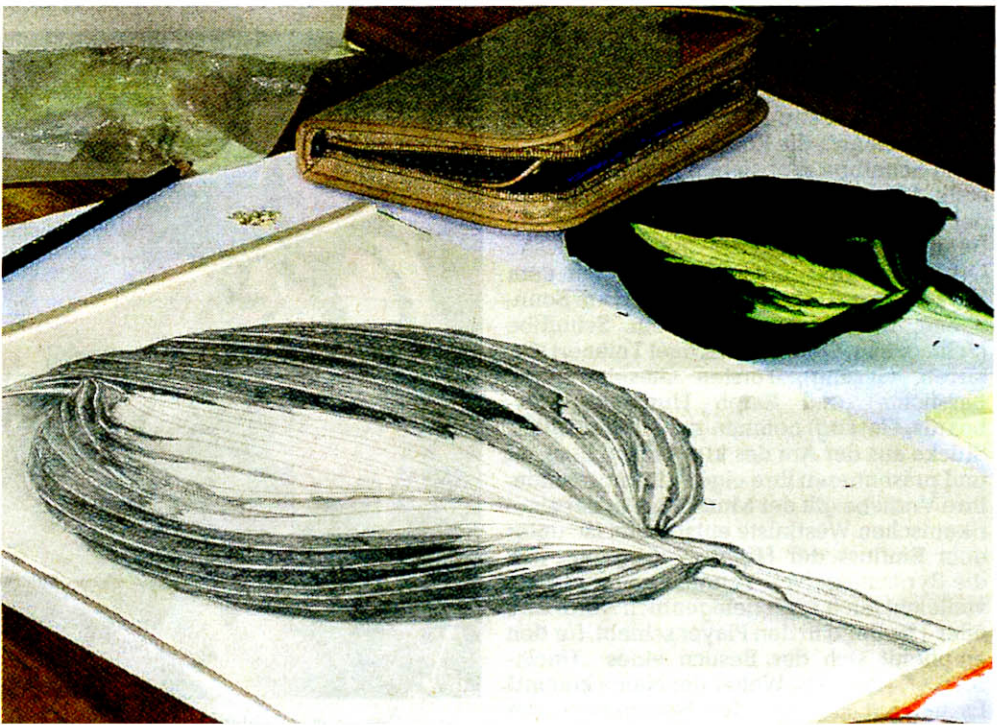
Das Objekt der Beobachtung und die zeichnerische Wiedergabe – die Workshop-Teilnehmer lernen, Gesehenes umzusetzen.